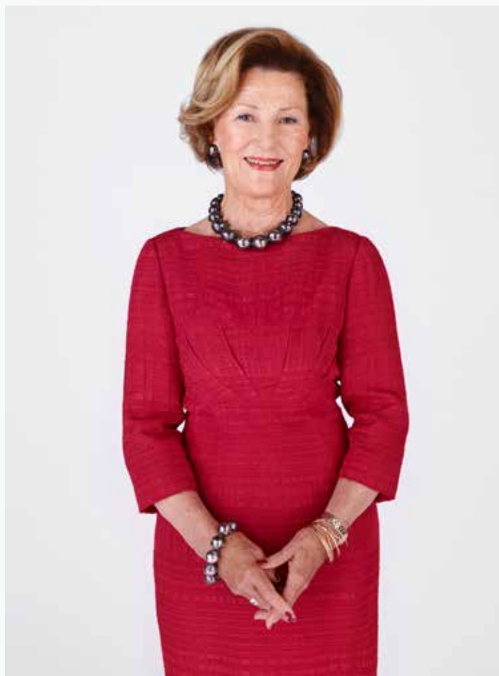
H. M. Dronning Sonja

Den Norske Opera & Balletts høye beskytter